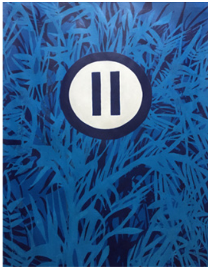
P de Pausa (2010). Acrílico sobre papel, 59,4 x 42cm

Diante de uma tela, o espectador deixa de ser consumidor de imagens para se tornar contemplador. Algo se reorganiza interiormente nesse gesto de atenção prolongada. A contemplação é uma forma plena de presença: estar inteiro diante do que é, sem ruído, sem distração. Talvez o mundo precise, antes de tudo, de reaprender a estar presente.