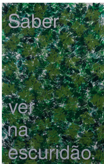
Saber ver na escuridão (2021). Acrílico e serigrafia sobre dibond, 150 x 95cm