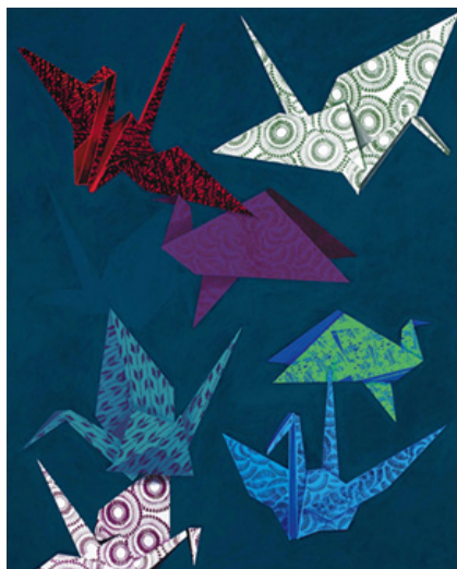
O de Origami (2010). Acrílico sobre tela, 150 x 120cm

Costuma dizer-se que a arte não serve para nada. Talvez seja precisamente por isso que ela serve para tudo. Quando um artista traça uma linha sobre um suporte, não executa apenas um gesto técnico: inaugura um mundo. A pintura torna visível o invisível, dá corpo ao que é sentido, sonhado ou temido. Como lembra Juan Villoro, “Os desenhos nas grutas de Altamira revelam que ao ser humano não basta caçar bisontes: também precisa de os representar” (2025: 43).