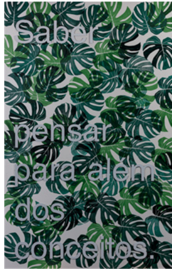
Saber pensar para além dos conceitos (2021). Acrílico e serigrafia sobre dibond, 150 x 95cm

Cada pintor estende uma ponte entre o que é e o que poderia ser. A essa ponte chama-se imaginação. Antes de mudar o mundo, é preciso ser capaz de imaginá-lo diferente. O quadro é, assim, uma promessa: de beleza, de sentido, de cor – mesmo no meio da dor.