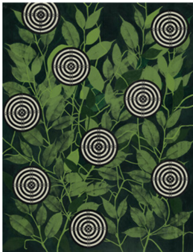
Alvos (2019). Acrílico sobre papel, 59,4 x 42cm

É neste contexto que a arte, e em particular a pintura, reaparece como possibilidade de resistência. Pintar – e contemplar uma pintura – é resistir à pressa, à superficialidade e à exigência de utilidade imediata. A pintura propõe um tempo outro: um tempo suspenso, denso, onde a experiência não se consome, mas se aprofunda.