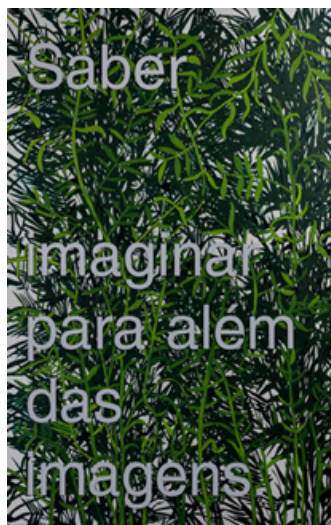
Saber imaginar para além das imagens (2021). Acrílico e serigrafia sobre dibond, 150 x 95cm