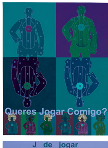
J de Jogar (2008). Acrílico sobre tela, 166 x 120cm

Costuma dizer-se que a arte não serve para nada. Talvez seja precisamente por isso que ela serve para tudo. Quando um artista traça uma linha sobre um suporte, não executa apenas um gesto técnico: inaugura um mundo. A pintura torna visível o invisível, dá corpo ao que é sentido, sonhado ou temido. Como lembra Juan Villoro, “Os desenhos nas grutas de Altamira revelam que ao ser humano não basta caçar bisontes: também precisa de os representar” (2025: 43).