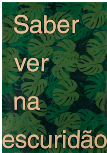
Saber ver (2021). Acrílico sobre papel, 118,5 x 85cm

Ao entrar nesse mundo criado, o observador também se transforma. Por instantes, vê através do olhar de outro ser humano. É nessa troca silenciosa que pode residir uma forma de salvação: a arte atribui sentido a um mundo que frequentemente se apresenta como opaco ou indiferente.