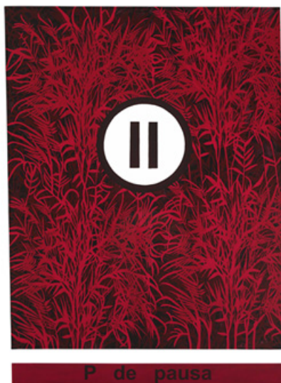
P de Pausa (2009). Acrílico sobre tela, 166 x 120cm 1

Há quem diga que o mundo precisa de ser salvo – e talvez precise mesmo. Não de um apocalipse súbito nem de uma catástrofe natural, mas de algo mais silencioso e insidioso: o esquecimento da beleza, o adormecimento da sensibilidade, a indiferença perante o que é humano. A ameaça que hoje se coloca não é a destruição imediata, mas a erosão lenta da atenção e da presença.