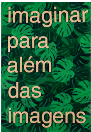
Saber imaginar (2021). Acrílico sobre papel, 118,5 x 85cm