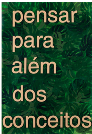
Saber pensar (2021). Acrílico sobre papel, 118,5 x 85cm

A pintura pode, assim, ser pensada como um lugar de conhecimento. Um lugar onde se aprende a ver na escuridão, a imaginar para além das imagens dadas, a pensar para além dos conceitos estabilizados. Não se trata tanto de apresentar imagens acabadas, mas de criar as condições para que a imagem possa surgir no interior de quem olha.