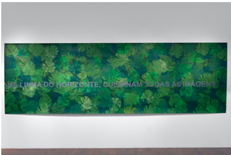
Linha do horizonte (2025). Spray acrílico sobre papel, 152 x 475cm

Talvez, no fim de contas, salvar o mundo signifique apenas isto: não o deixar endurecer por completo. Manter acesa, nas cores e nas formas, a memória de que o humano ainda existe. Enquanto houver quem pinte – e quem olhe –, ainda haverá esperança.