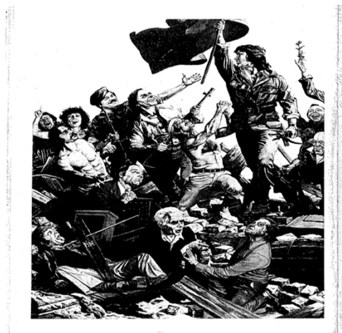
Les capitaines d'avril (MFA) conduisant le peuple.

Keywords: 25 April, revolution, the left, democracy, politics.