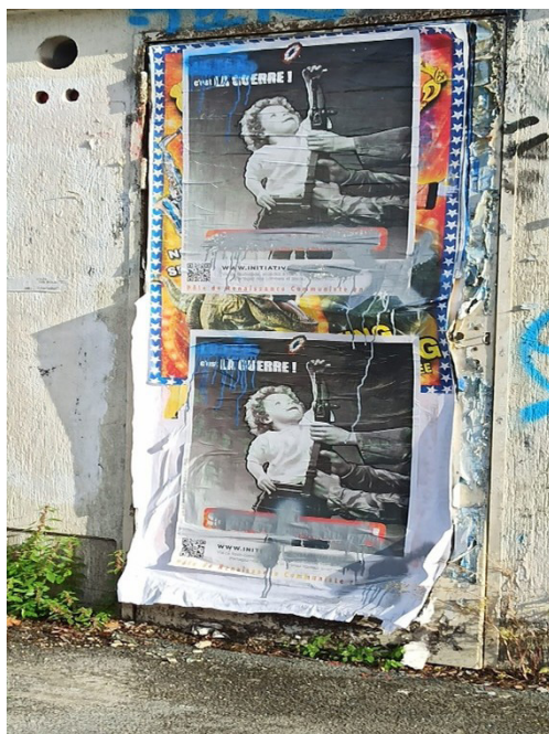
Figure 2 - Photo prise à Bordeaux en 2022.

Si parfois ce partage de référents à un moment donné gagne une dynamique transnationale inouïe, comme dans le cas de la photo-symbole prise par Sérgio Guimarães, celle d'un petit garçon qui dépose un œillet dans le canon d'un fusil, une photo qui franchit les frontières (Figure 2), appropriation culturelle trouvée à Bordeaux, dans une affiche du Pôle de Renaissance Communiste, souvent les hétéro-images sur le Portugal deviennent des imagotypes assurant le dialogue sur le Portugal entre auteurs et lecteurs par le biais d'un décor prévisible.