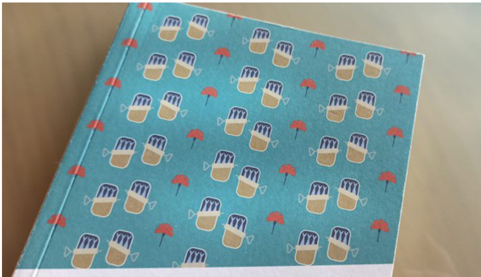
Figure 1 - Détail de la couverture de Portugal. Les œillets d'Amália .

Mais ces lieux communs, les topoi attendus, ne les trouvait-on pas tout au départ de notre contact avec le texte de Michel Zumkir malgré sa conscience du stéréotype ? Et l'auteur ne mise-t-il pas sur le plaisir de la reconnaissance que dès le XIXe siècle on cultive dans les récits de voyage avec les choix graphiques de la couverture (Figure 1) et du titre, mêlant deux éléments de la contemporanéité qui attirent l'attention sur « ce magnifique minuscule petit pays » ( ibidem ) dont on savait si peu, et dont aujourd'hui on reconnaît les référents obligés ?